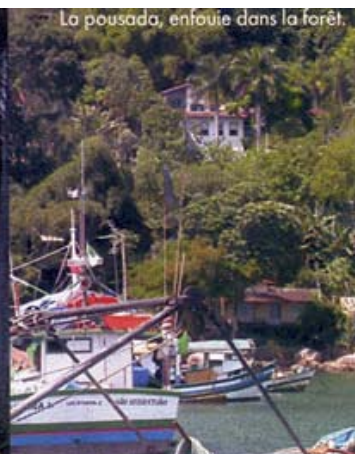
La pousada, enfouie dans la forêt.